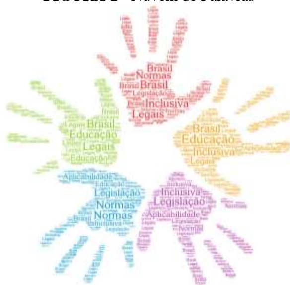
FIGURA 1 - Nuvem de Palavras

Por meio da Plataforma online WordArt , o conteúdo textual dos artigos selecionados foi analisado por meio da frequência de palavras, que resultou na nuvem de palavras, correspondente a Figura 1.